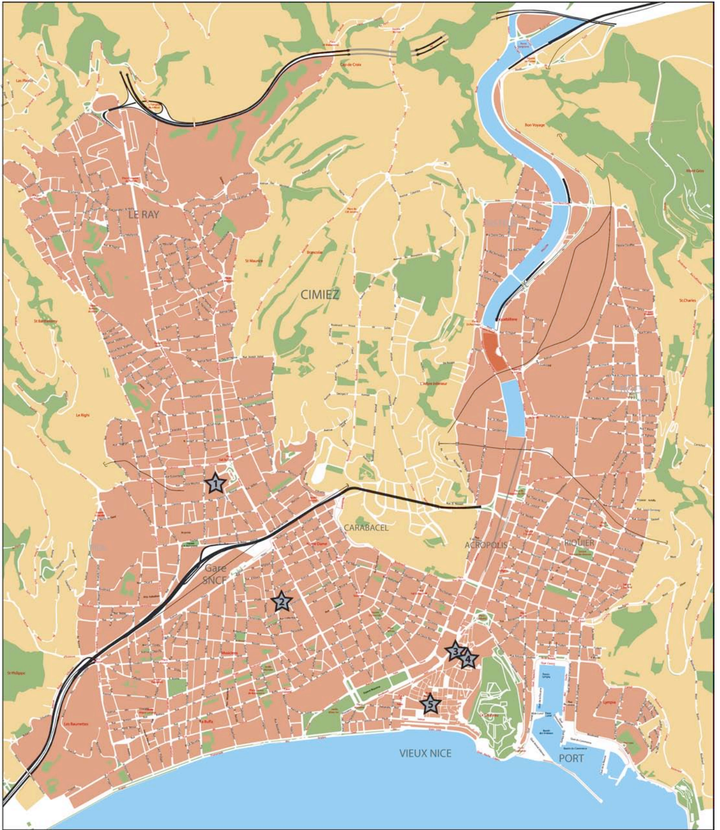
Fig. 1 - Plan de Nice avec localisation des sites (DAO M. Bouiron sur fond de plan SIG/Ville de Nice).