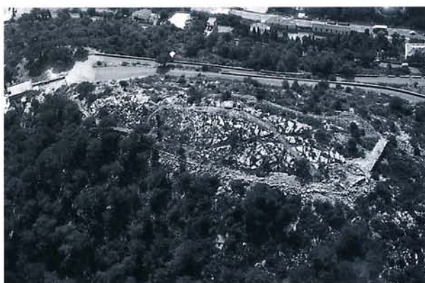
Fig. 1 - Vue aérienne du site et de la structure en pierres sèches du mont des Mules.